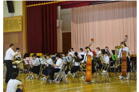
吹奏楽部県大会出場激励会

1, 2年生は38日間, 3年生は37日間の夏休みが終わりました。夏休み中は, P T A校外指導委員の皆さんの地区巡視や地域の行事等でお世話になりました。生徒たちは, 安全に家庭や地域の中で夏休みを過ごせたことが何よりだったと思います。今年の夏は, 観測史上稀にみる長雨でしたが, 先週末から青空が戻り, 朝晩は, 虫の声とともに秋の気配を感じる頃となりました。今日から81日間の長い2学期が始まります。行事をはじめ様々な面で保護者や地域の皆様のご協力・ご支援をよろしくお願いいたします。